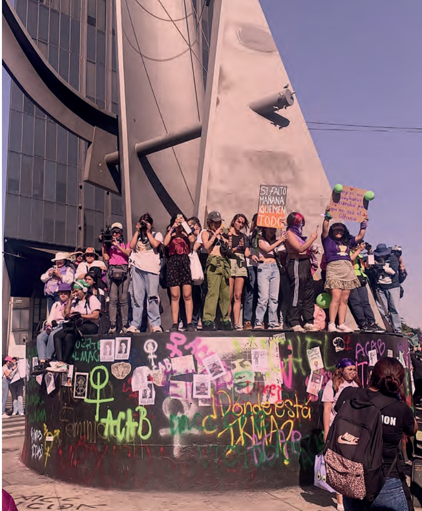
Pág. 18 arriba: La femineidad vive en todes (2022).