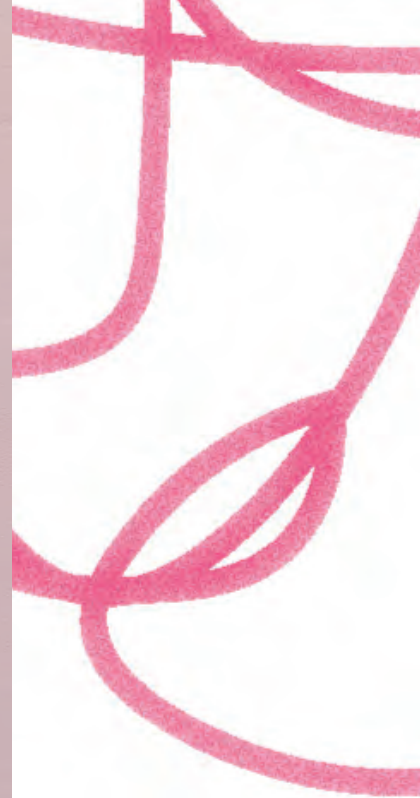
Disfruta el espacio que habitas (2022).

Entrelazar mi historia con la de mis ancestras es una oportunidad que se me ha ofrecido de autoconocimiento y vulnerabilidad para entender que cambiar la historia es un acto revolucionario desde el amor para honrar a mis mujeres. Reconocer sus dolores, alegrías, injusticias, logros.