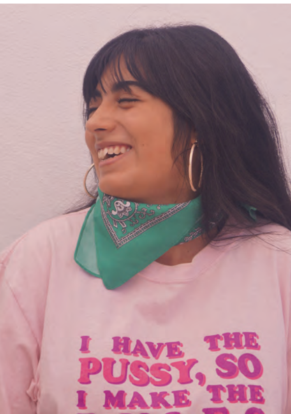
Pág. 19 abajo: Amor de amigas (2023).