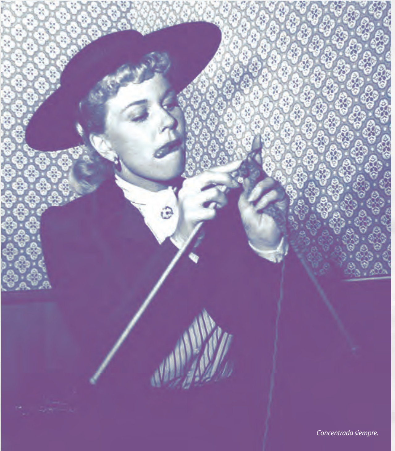
Imagen: Wikimedia Commons .